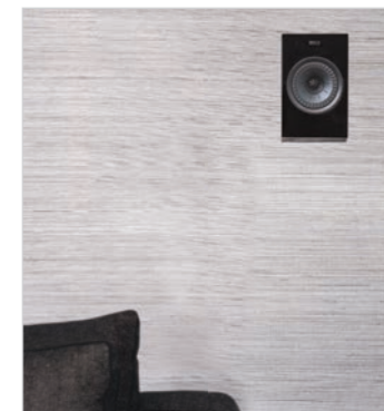
R8a an der Wand